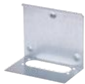
WALL FASTENING PLATE Seinäasennuskiinnike (9916062) SSSL 3420009