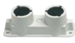
EPA 1230 SET