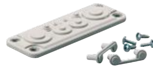
FMB 5F-SET Kalvotiivistelaippa (3590794) SSSL 3413022