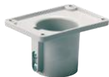
MB 16026 SET Pylväsasennuslaippa (3596026) SSSL 3413090