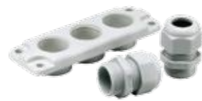
PIHA-L 3xPG21 Laippasetti (3550214) SSSL 3413026